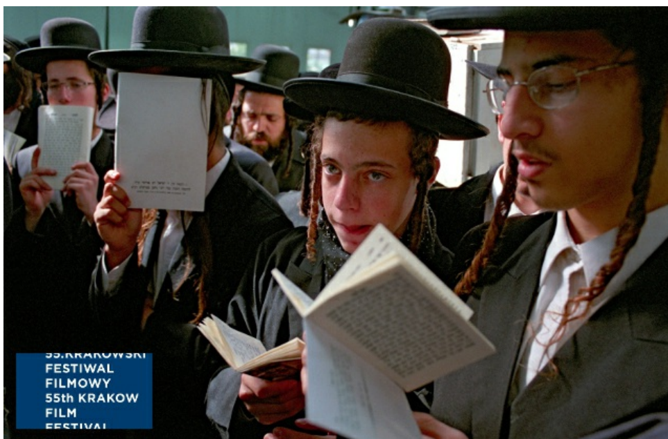
„Dybuk. Rzecz o wędrówce dusz”, reż. Krzysztof Kopczyński

„ Mów mi Marianna ” Karoliny Bielawskiej to z kolei intymny portret człowieka uwięzionego w cudzym ciele i jego drogi do samorealizacji – najmocniejszy chyba jak dotąd w polskiej dokumentalistyce obraz z kręgu tematów LGBT.